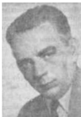
Ilustracja 6: Prof. Stanisław Mazur

W 1920 roku profesor Antoni Łomnicki (1881–1941) zatrudnił Banacha jako swojego asystenta na Politechnice Lwowskiej, pomimo tego, że Banach nie ukończył formalnie studiów uniwersyteckich. Stefan Banach razem z żoną zamieszkał w gmachu uniwersytetu przy ul. św. Mikołaja. Od tego momentu zaczęła się błyskotliwa i bardzo szybka kariera naukowa Banacha. Tego samego roku, na Uniwersytecie Jana Kazimierza we Lwowie, Banach przedstawił tezy swojej pracy doktorskiej. Praca ta została opublikowana w trzecim tomie Fundamenta Mathematicae pt. Sur les opérations dans les ensembles abstraits et leur application aux équations intégrales (O operacjach na zbiorach abstrakcyjnych i ich zastosowaniach do równań całkowych) w 1922 roku.