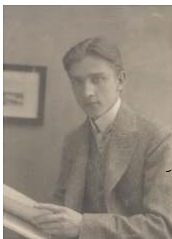
Ilustracja 3: Stefan Banach w wieku 27 lat. Kraków 1919 rok

Spotkanie Steinhausa i Banacha miało niemal natychmiastowe konsekwencje naukowe i zaowocowało wieloletnią współpracą i przyjaźnią. Pierwsza publikacja Banacha, napisana wspólnie ze Steinhausem, opublikowana w „Biuletynie Akademii Krakowskiej” w 1919 roku, nosiła tytuł: Sur la convergence en moyenne de séries de Fourier (O zbieżności w przeciętnej szeregu Fouriera).