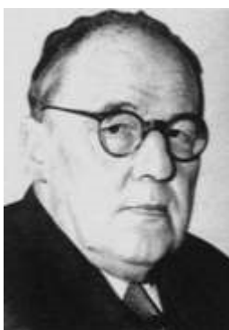
Ilustracja 4: Prof. Wacław Sierpiński

dziedziny oraz zainicjował wydawanie czasopisma poświęconego wyłącznie działom powiązanych z teorią mnogości i podstawami matematyki. Uważał, że publikowanie w języku francuskim spełni podwójną rolę: przybliży społeczności światowej osiągnięcia polskich matematyków, a z drugiej strony zachęci do publikowania ludzi z zagranicy, którzy zajmowali się podobnymi zagadnieniami. Dzięki temu czasopismo stałoby się międzynarodowym forum, poświęconym nowej gałęzi matematyki, którą stworzyli Polacy. Janiszewski apelował do warszawskiego środowiska matematycznego w ten sposób: „Chcąc zdobyć sobie odpowiednie stanowisko w świecie naukowym, przyjdźmy z własną inicjatywą”. I ten cel został osiągnięty w krótkim czasie. Pierwszy tom Fundamenta Mathematicae ukazał się w 1920 roku. Jego wydawcami byli Stefan Mazurkiewicz (1888–1945) i Wacław Sierpiński (1882–1969).