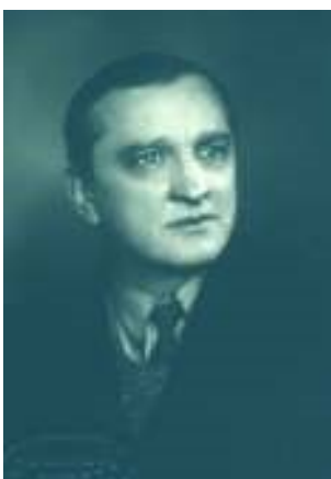
Ilustracja 10: Prof. Stefan Banach, Lwów 1944 rok