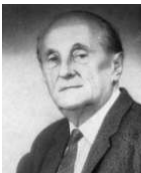
Ilustracja 2: Prof. Hugo Steinhaus