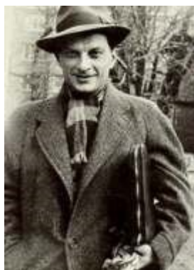
Ilustracja 8: Prof. Stanisław Ulam