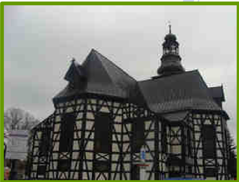
Kościół parafialny p.w. św. Andrzeja Boboli

Kościół powstał w 1709 roku jako Kościół Łaski, ma barokową konstrukcję ryglową i wieżę. Wieża jest nieznacznie przechylona z hełmem cebulastym i prześwietem z blachy, nakrytym daszkiem z mniejszym hełmem. Szczyt wieży jest zwieńczony iglicą z krzyżem na kuli.