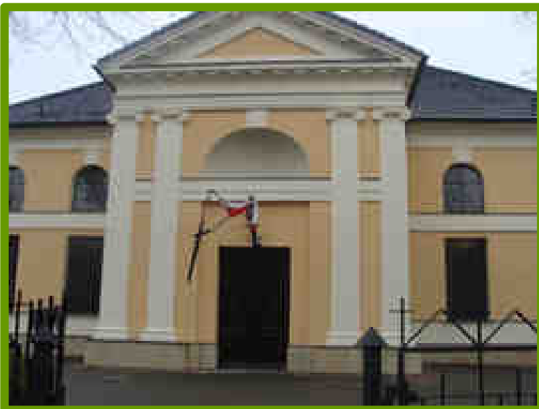
Klasycystyczny Kościół parafialny p.w. św. Michała Archanioła został zbudowany w latach 1817-1821.